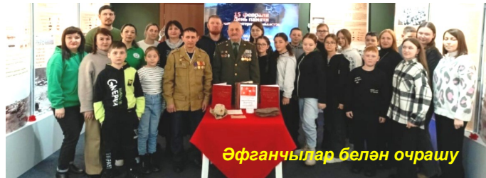
Әфганчылар белән очрашу