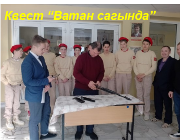
Квест “Ватан сагында”