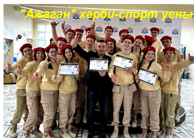
“Азаган” хәрби-спорт үенә