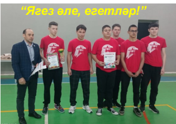
“Язгыз әле, егетләр!”