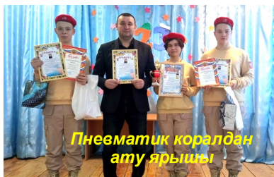
Пневматик коралдан ату ярышы